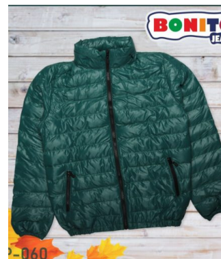
КУРТКА ДЛЯ МАЛЬЧИКОВ (Х100 ШТ)

Куртка для мальчиков. Сезон: Осень-зима. Размеры: 140-165. Возраст: 10-14.