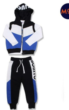
КОМПЛЕКТ ДЛЯ МАЛЬЧИКОВ (Х90 ШТ)

Комплект для мальчиков. Сезон: Осень-зима. Размеры: 98-122. Возраст: 3-7.