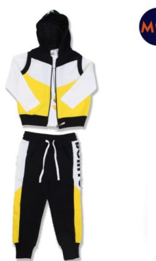
КОМПЛЕКТ ДЛЯ МАЛЬЧИКОВ (Х90 ШТ)

Комплект для мальчиков. Сезон: Осень-зима. Размеры: 98-122. Возраст: 3-7.