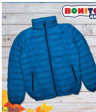
КУРТКА ДЛЯ МАЛЬЧИКОВ (Х100 ШТ)

Куртка для мальчиков. Сезон: Осень-зима. Размеры: 140-165. Возраст: 10-14.