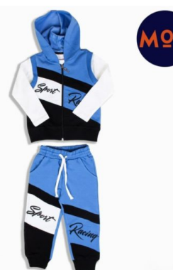
КОМПЛЕКТ ДЛЯ МАЛЬЧИКОВ (Х90 ШТ)

Комплект для мальчиков. Сезон: Осень-зима. Размеры: 98-122. Возраст: 3-7.