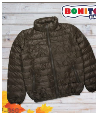
КУРТКА ДЛЯ МАЛЬЧИКОВ (Х100 ШТ)

Куртка для мальчиков. Сезон: Осень-зима. Размеры: 140-165. Возраст: 10-14.