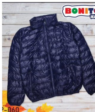
КУРТКА ДЛЯ МАЛЬЧИКОВ (Х100 ШТ)

Куртка для мальчиков. Сезон: Осень-зима. Размеры: 140-165. Возраст: 10-14.