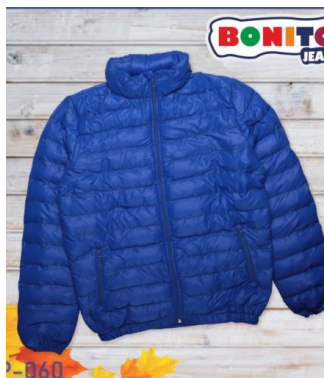
КУРТКА ДЛЯ МАЛЬЧИКОВ (Х50 ШТ)

Куртка для мальчиков. Сезон: Осень-зима. Размеры: 140-165. Возраст: 10-14.